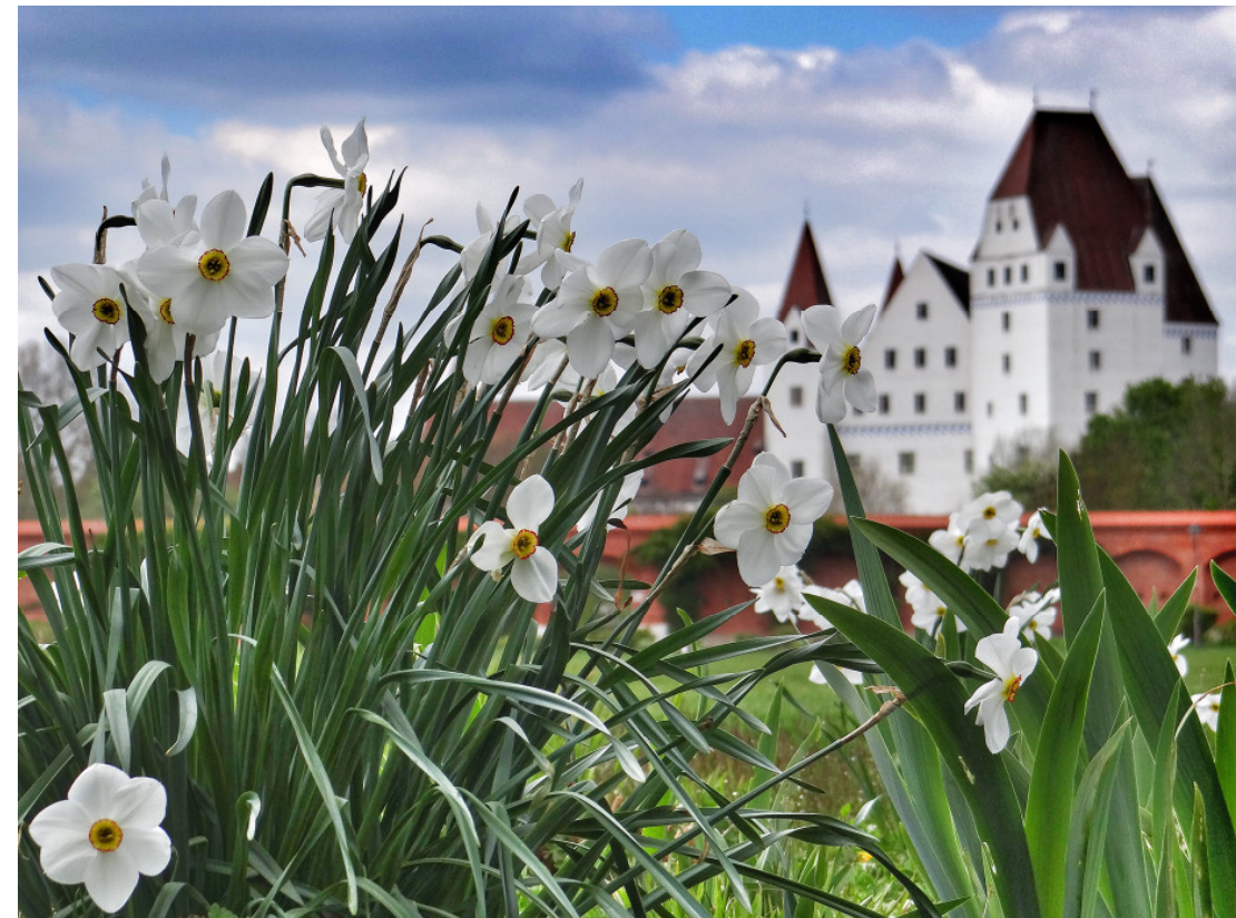
Gartenschau Stadt Ingolstadt

Die beigefügten Allgemeinen Reisebedingungen sind Bestandteil dieses Prospektes.